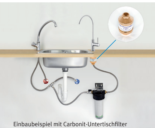
Einbaubeispiel mit Carbonit-Untertischfilter

Ich möchte mich bei Ihnen auf diesem Weg recht herzlich für ein echtes Stück Lebensqualität bedanken. Ich benutze Ihre Produkte mittlerweile seit mehr als zwei Jahren. Sie wissen von meinem Wunsch mich möglichst natürlich zu ernähren, und ich kann heute wirklich sagen, dass ich mich mit meinem Wasser sehr sicher fühle. Mit meinem Untertischfilter bin ich bis heute ausgesprochen zufrieden. Den „Frischekick“ des UMH Wirblers genieße ich wie am ersten Tag. Ich möchte heute kein anderes Wasser mehr trinken.